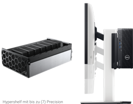
Hypershelf mit bis zu (7) Precision 3280 CFF in einem 5-HE-Rack

Setzen Sie selbst Ihre ambitioniertesten Ideen in die Tat um – mit einer Workstation , die Ihren Kompetenzen entspricht, ohne Ihr Budget zu sprengen. Diese Workstations sind im kompakten, kleinen Formfaktor- und Tower-Design erhältlich und daher ideal für Arbeitsplätze mit begrenztem Platzangebot sowie für einige Edge-Szenarien. Sie eignen sich optimal für Anwendungen in den Bereichen Finanzen, Design, Kreativität und viele mehr.